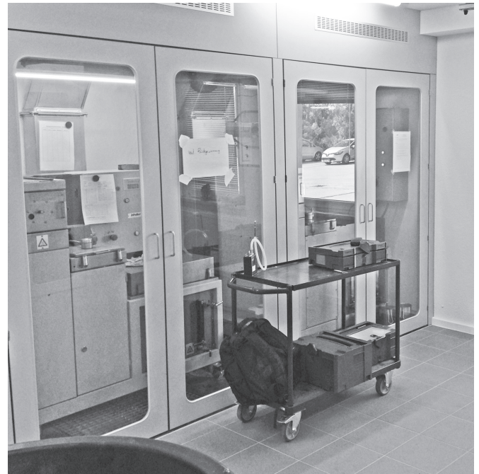
Bild 2. Extraktionsanlage nach dem Waschtrommelverfahren.

Bild 2 zeigt eine Extraktionsanlage nach dem Waschtrommelverfahren, die sich in einer in ihrer Wirksamkeit mit einem Laborabzug vergleichbaren, wirksamkeitsgeprüften technischen Einrichtung befindet. In dem Raum befanden sich insgesamt drei derartige Extraktionsanlagen in jeweils eigenem Absaugschrank. Davor ist eine personenbezogene, stationäre Probenahme zu sehen. Die Belastung gegenüber Trichlorethen lag in diesem Arbeitsbereich zum Zeitpunkt der Ermittlung im zeitlich gewichteten Mittelwert der personenbezogenen Messungen bei 0,70 \text{ mg m}^{-3} .