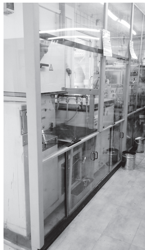
Bild 3. Abgesaugte, wirksamkeitsgeprüfte Einhausung mit zwei Extraktionsanlagen nach dem Waschtrommelverfahren, einer geschlossenen Bitumenspülmaschine, einem Trockenschrank sowie zwei Rotationsverdampfern. Die Ermittlung erfolgte hier personengetragen.

chlorethen [11 bis 13] auf den Wert der Akzeptanzkonzentration abzusinken, sodass der Bereich mittleren Risikos nach TRGS 910 wegfällt. Die Veröffentlichung des neuen Beurteilungsmaßstabes wird in der TRGS 910 erfolgen.